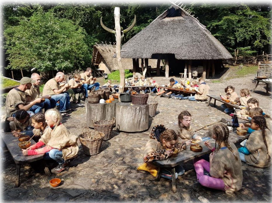
HASP-kamp groep 8